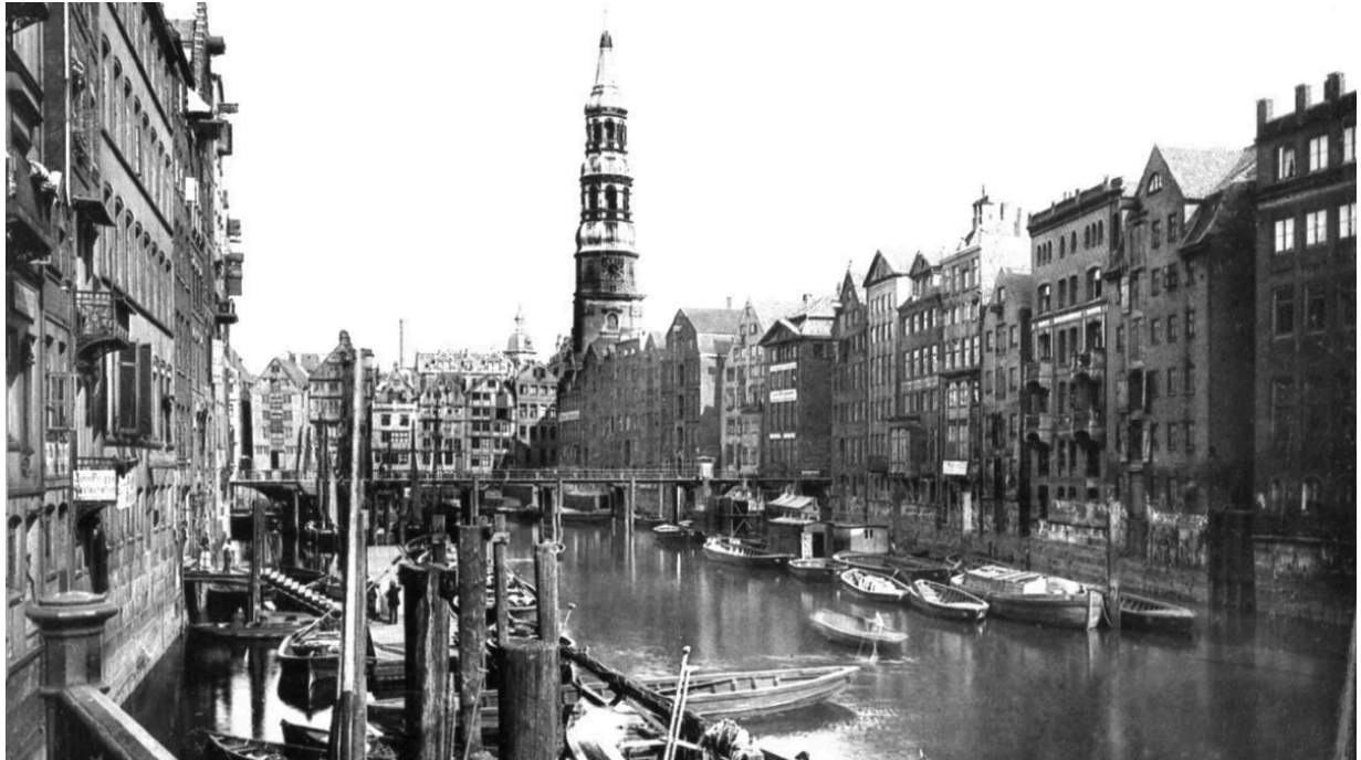
Ein historisches Bild zeigt das Leben auf Hamburgs Fleeten.

dann kam Corona“, sagt Ewers. „Vielleicht hilft ja dieser Podcast. Ich habe die Idee oft präsentiert und bin auf viel Begeisterung gestoßen; allein an der Umsetzung hapert es.“